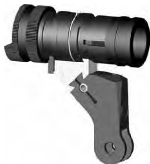
Bild 9: Universalkornträger zu Stgw 57 (Normalmontage), diverse Fabrikate