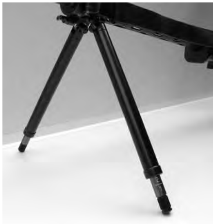
Bild 7: Verstellbare Zweibeinstütze zu Stgw 57, diverse Fabrikate