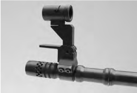
Bild 10: Kornträger als Visierverlängerung (Laufmontage), diverse Fabrikate