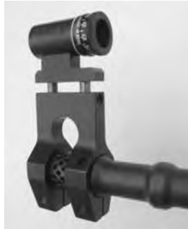
Bild 11: Kornträger als Visierverlängerung (Montage auf Mündungsbremse), diverse Fabrikate