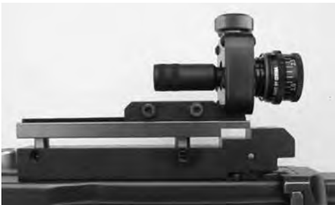
Bild 12: Diopterträger zu Stgw 57 zur Aufnahme schussfester Diopter, diverse Fabrikate