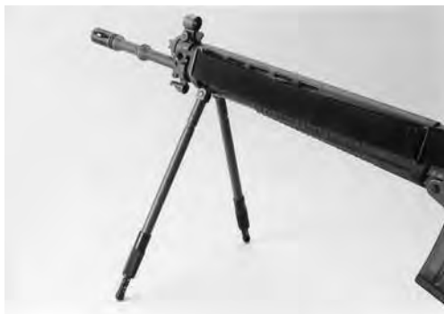
Bild 2: Verstellbare Zweibeinstütze zu Stgw 90, diverse Fabrikate