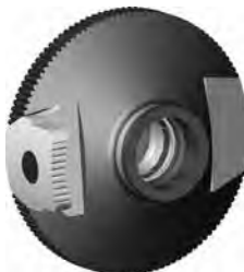
Bild 6: Rondelle für Farbfiltereinsatz an Irisblende zu Stgw 90 diverse Fabrikate