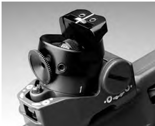
Bild 4: Excenter-Farbfilter mit Schiebekassette zu Stgw 90, Modell Grünig & Elmiger; Modell Wyss ähnlich