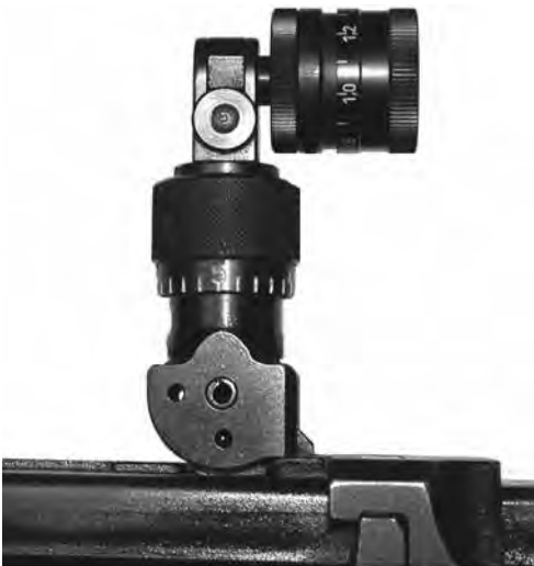
Bild 8: Irisblende zu Stgw 57 (mit und ohne Farbfilter), diverse Fabrikate

Gestattet sind alle im Fachhandel erhältlichen unveränderten Lochscheiben und Irisblenden mit oder ohne Farb- und Polarisationsfilter zur Montage auf dem unveränderten Ordonnanzdioptr. 01.01.2011